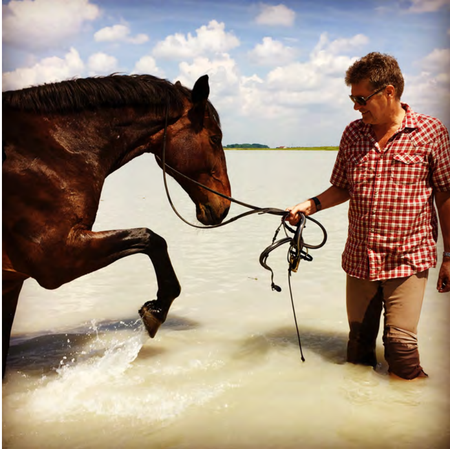
Darscho-Lacke im Sommer